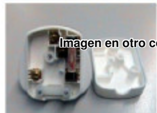
Imagen en otro color