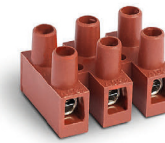
Serie LP Versione con lamella di protezione Version with wire protector