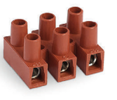
Serie F Versione ribassata Flat base version