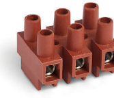
Serie H Versione rialzata Raised base version