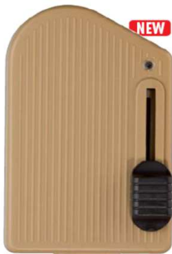
RT81 LED P cod. RL1120/led