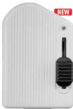
RT81 LED B cod. RL1112/led