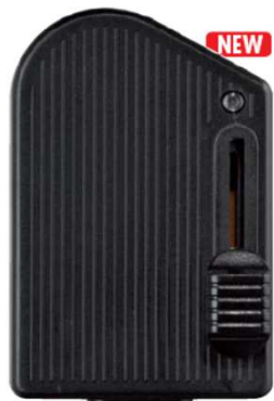
RT81 LED N cod. RL1104/led